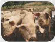
동물 중 돼지·멧돼지만 감염

Q 1 아프리카돼지열병(African Swine Fever, ASF)은 어떤 질병인가요?