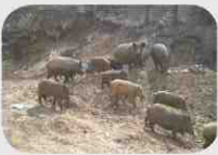
돼지 간 바이러스 전파가능